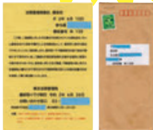
【実際に届いた封書の例】